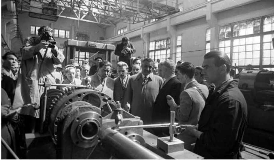
زيارة مصنع جوركي لبناء الماكينات بكيفيف ١٩٥٨/٥/٨